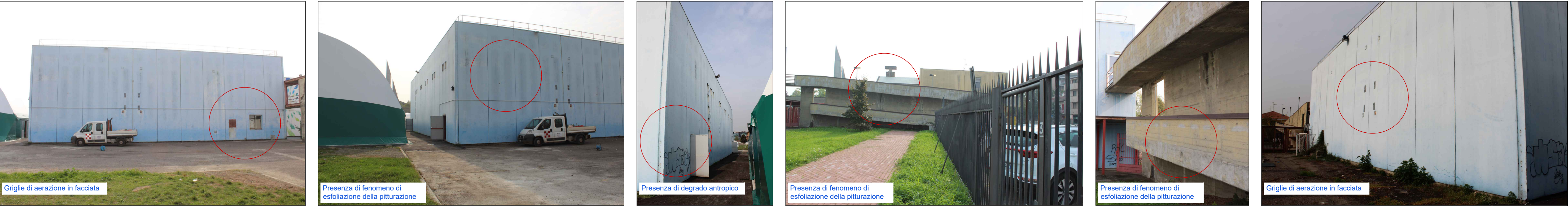
Viste esterne - Prospetto Ovest