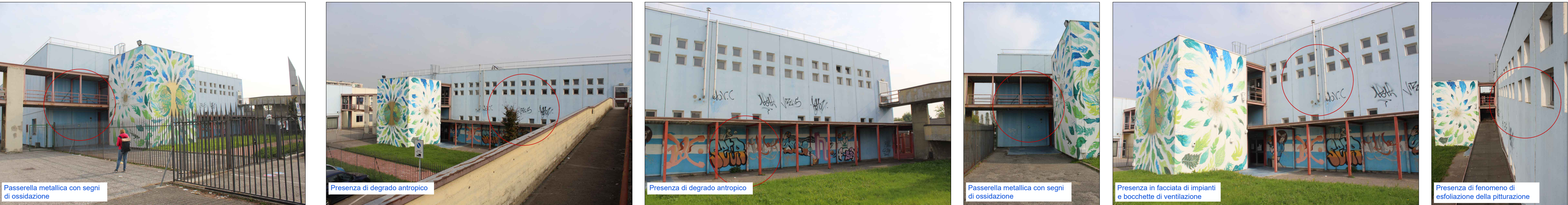
Viste esterne - Prospetto Ovest